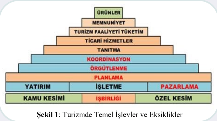
Şekil 1: Turizmde Temel İşlevler ve Eksiklikler

Son yıllarda UNWTO’nun da dünya çapında yeterince başarılı olamadığı bu yaklaşımın, önümüzdeki yıllarda tekrar ele alınması ve yükselen bir trend olması kaçınılmazdır. 2023 Stratejimizde öngörülmüş olan “alt yörelerdeki konseylerin illerde ve 81 ilin de Başkent’te bütünleşerek Ulusal Konsey oluşturması modeli” ise, DMO Modelinde de yer almayan ve tüm dünyaya örnek teşkil edecek önemli bir sentez